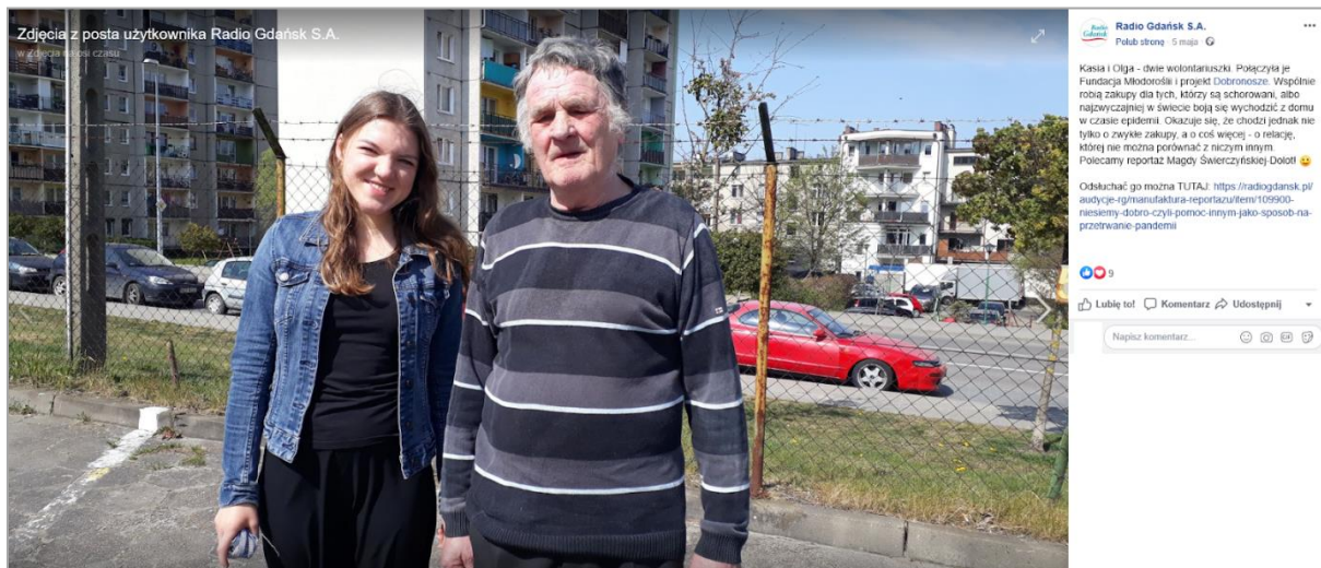
Rysunek 3. Informacja o reportażu "Niesiemy dobro" na profilu Radia Gdańsk na Facebook'u

https://m.radiogdansk.pl/audycje-rg/manufaktura-reportazu/item/109900-niesiemy-dobro-czyli-pomoc-innym-jako-sposob-na-przetrwanie-pandemii/109900-niesiemy-dobro-czyli-pomoc-innym-jako-sposob-na-przetrwanie-pandemii