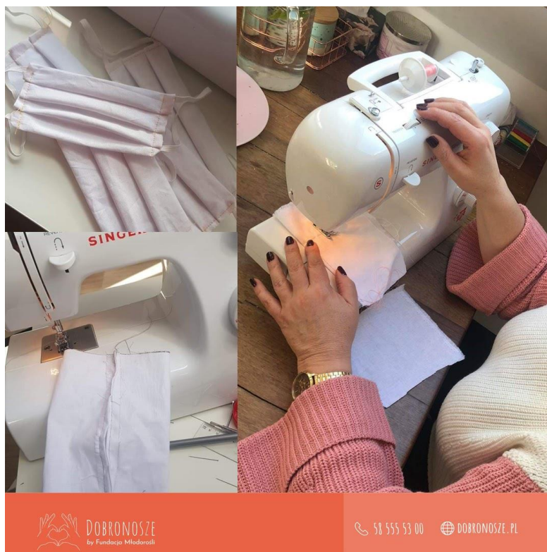
Rysunek 1. Szycie maseczek dla wolontariuszy

Kiedy pojawiła się informacja, że potrzebne są posiłki dla służby zdrowia, do pomocy zaangażowało się wiele osób, które chciały bezinteresownie wspomóc lekarzy i pielęgniarki w walce z pandemią. Codziennie publikowano zdjęcia z ich postępów przy produkcji jedzenia, co cieszyło się ogromnym zainteresowaniem i zachęcało innych do dalszego działania. Zmiana stylu życia dotknęła każdego z nas, ale w szczególności osoby najbardziej przyzwyczajone do poprzednich realiów, czyli seniorów. Dla nich codzienne wyjście do osiedlowego sklepu było częścią stylu życia, który w obecnej sytuacji stał się dość dużym zagrożeniem dla ich zdrowia. W tym przypadku z pomocą przyszli Dobronosze, którzy pomagają im w dostosowaniu się do obecnych zasad, dbając przy tym o bezpieczeństwo. W ciągu zaledwie dwóch tygodni struktura Dobronoszy rozrosła się do wielkości średniego, dobrze prosperującego przedsiębiorstwa, stwarzając przy tym społeczność wolontariuszy, dla których bycie Dobronoszem stało się również stylem życia, któremu poświęcają w dużej mierze swój wolny czas. Powstanie tych inicjatyw było również dobrym momentem do nauczenia się nowych umiejętności takich jak szycie maseczek dla wolontariuszy, pogłębienie zmysłu kulinarnego, tworzenie grafik promujących akcję oraz poprawienie zdolności komunikacyjnych.