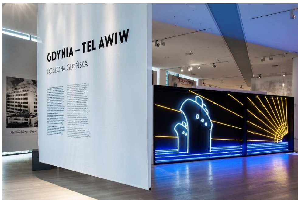
Ryc. 6. Instalacja LED będąca symbolem morza wraz z tablicą informacyjną dot. wystawy

Muzeum Miasta Gdyni dnia 1. maja 2020 roku, o godzinie 18:00, uruchomiło cyberprzestrzenną wystawę Gdynia – Tel Awiw , dostosowując się tym samym do restrykcji obowiązujących wszystkie instytucje kultury w Polsce w czasie pandemii. Warto wymienić trzy istotne wydarzenia, jakie towarzyszyły idei stworzenia wystawy. Przedsięwzięcie łączy się z obchodami 100-lecia powstania miasta Gdyni. Okrągła rocznica skłania do czerpania wiedzy związanej z tak młodym miastem oraz dostrzeżenia podobieństw z odległym o tysiące kilometrów Tel Awiwem. Izraelskie miasto portowe obchodziło swoje 110-te urodziny, co doskonale ukazało motyw przewodni wystawy – podobieństwo architektoniczne młodych miast. Trzecim istotnym elementem jest nawiązanie do 101-szej rocznicy założenia Bauhausu – niemieckiej szkoły, pod nazwą której kryje się nurt modernistyczny, za którym podążało wiele miast Europy i dzisiejszego Izraela. Tytułowe miasta dumnie reprezentują ową myśl przestrzenną i artystyczną, co można dostrzec podczas wystawy.