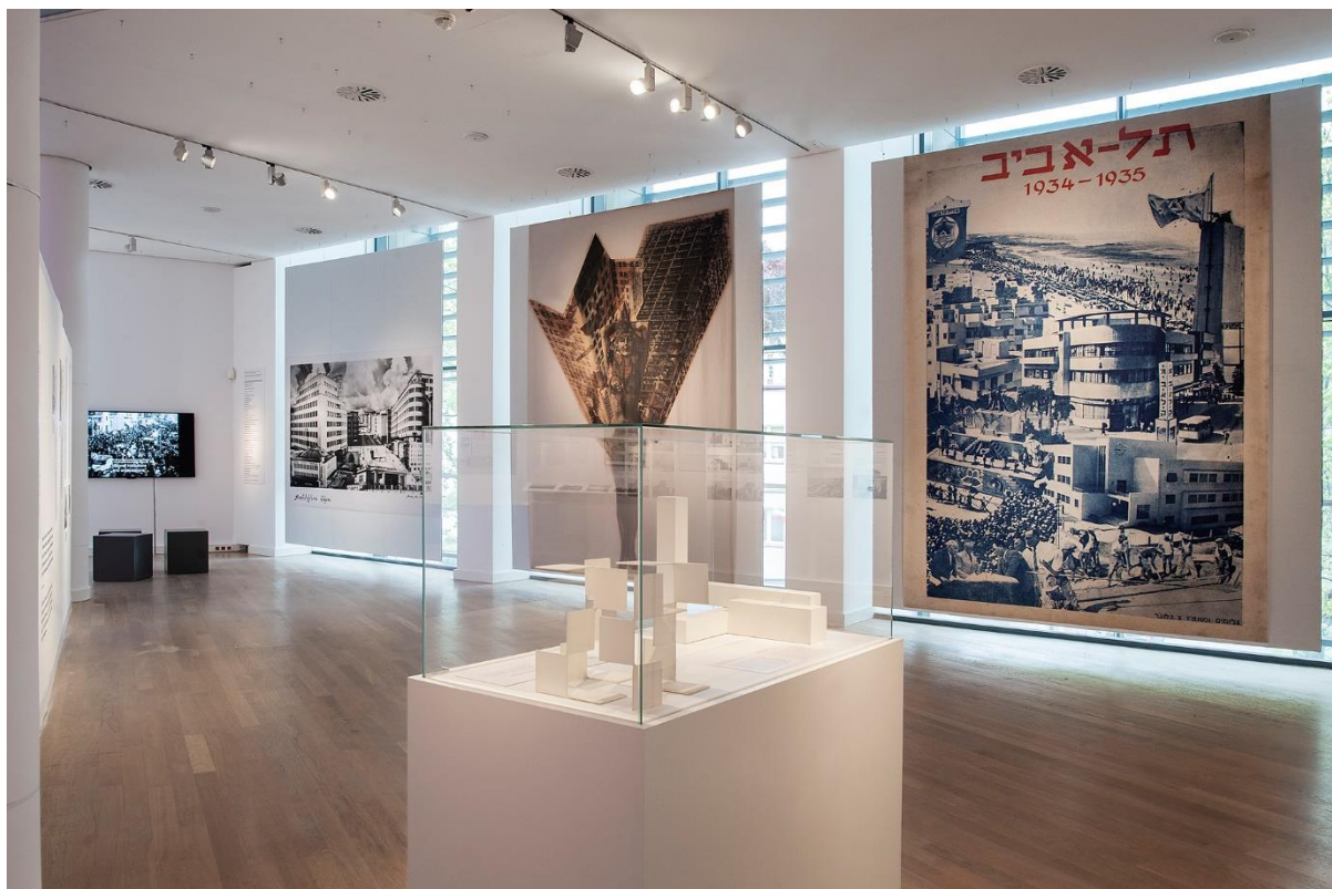
Ryc. 12. Fragment wystawy