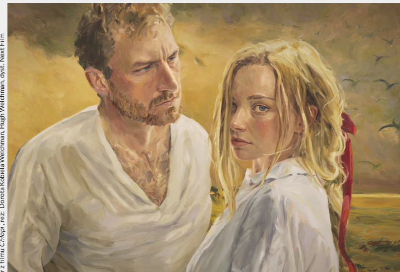
kadryz filmu Chłopi, reż. Dorota Kobiela Weichman, Hugh Weichman, dyst., Next.Film