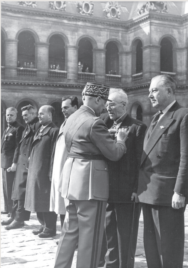
Zygmunt Lubicz-Zaleski odznaczony Orderem Legii Honorowej