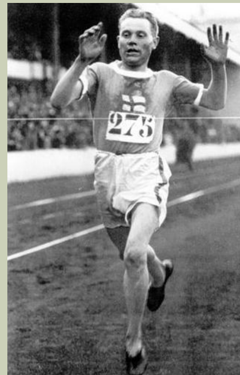
Paavo Nurmi – wielokrotny mistrz biegów olimpijskich